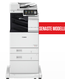
iR ADV DX C478